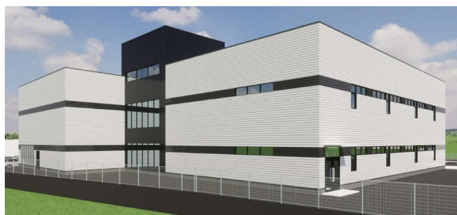
新分析棟(4号棟)完成予想図