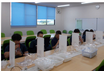
官能試験(3点比較式臭袋)

弊社では、平成15年9月に「臭気測定認定事業所」としての登録を行い、今年5回目の更新を行いました。また、におい・かおり環境協会の実施する、